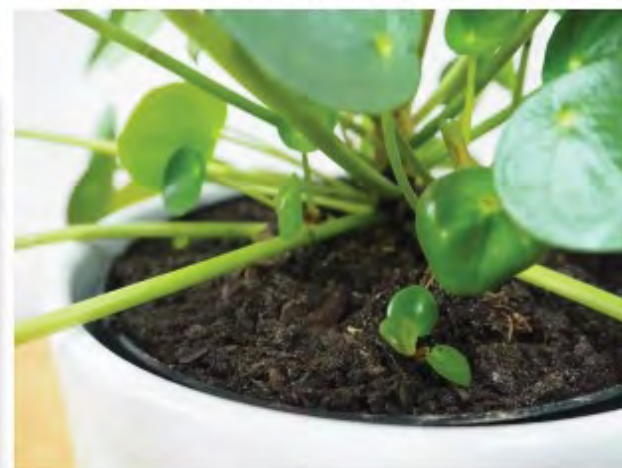
Elefantlör eller parasollpilea bildar själv små plantor runt stammen som du kan ta och plantera om i egna krukor.