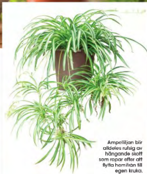
Ampellicyan blir alldeles rufsigt av hängande skott som repar efter att flytta hemifrån till egen kruka.