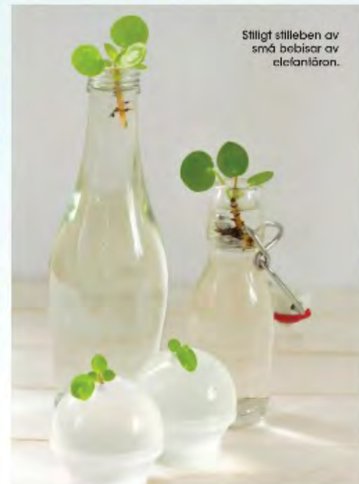
Stiligt stilleben av små bebisar av elefantlör.